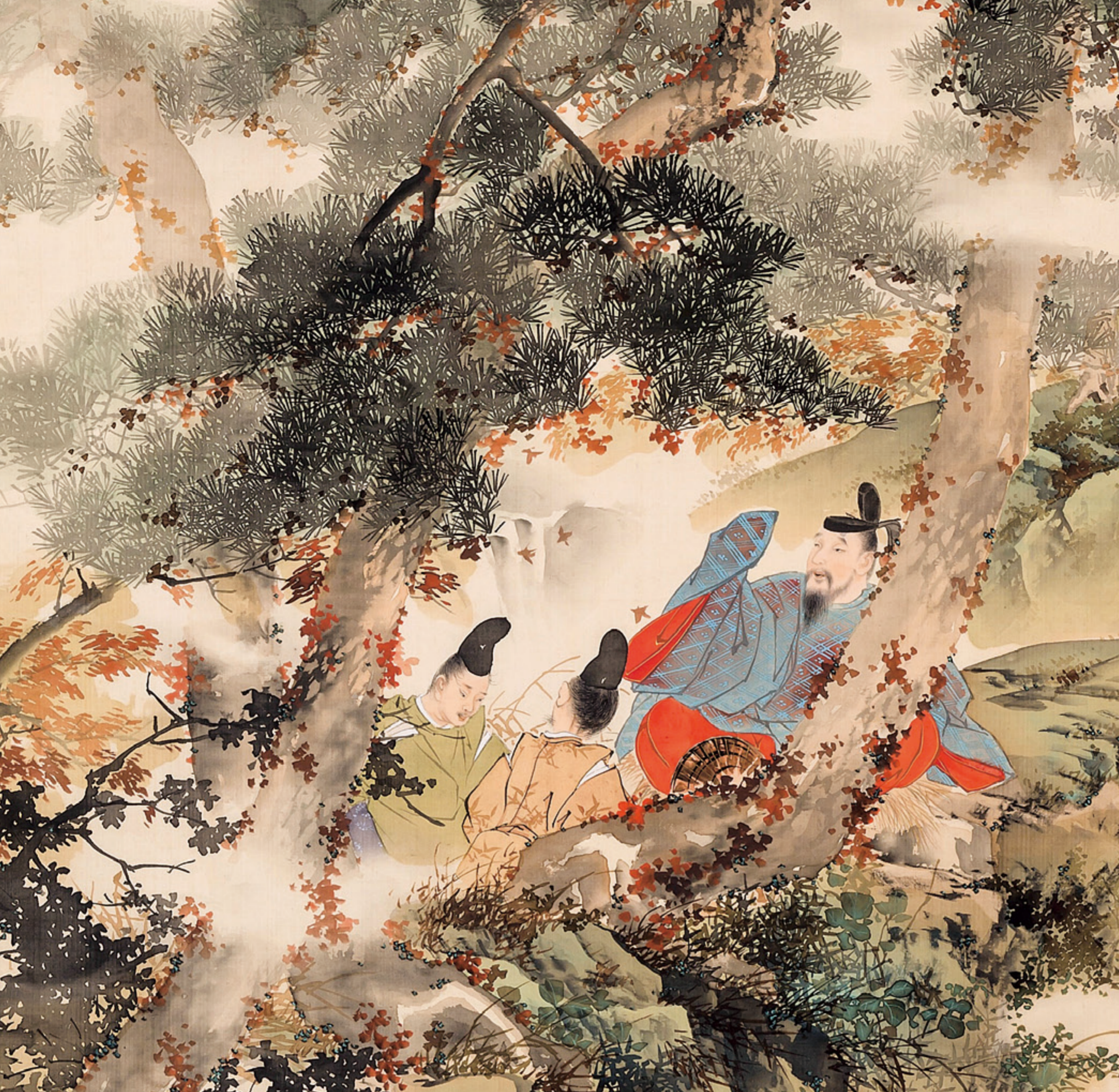
平福穂庵《笠置山蒙塵図》(部分) 明治21年(1888)