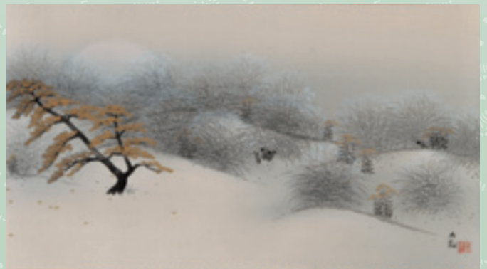
横山大観《武蔵野》昭和9年(1934)