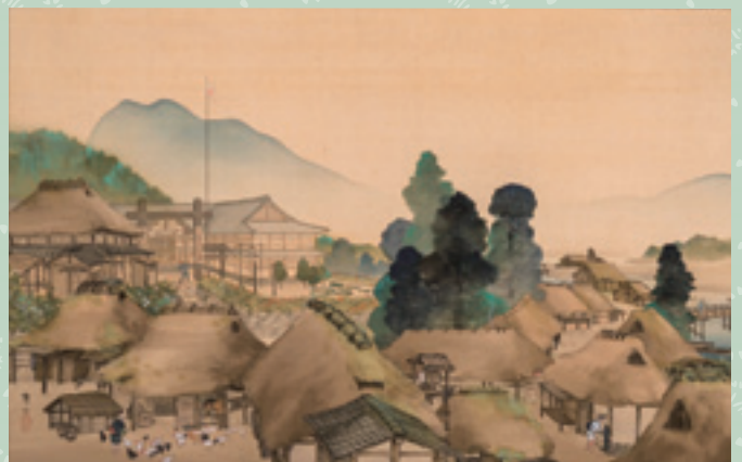
今村紫紅《村落朝景》明治43年(1910)頃